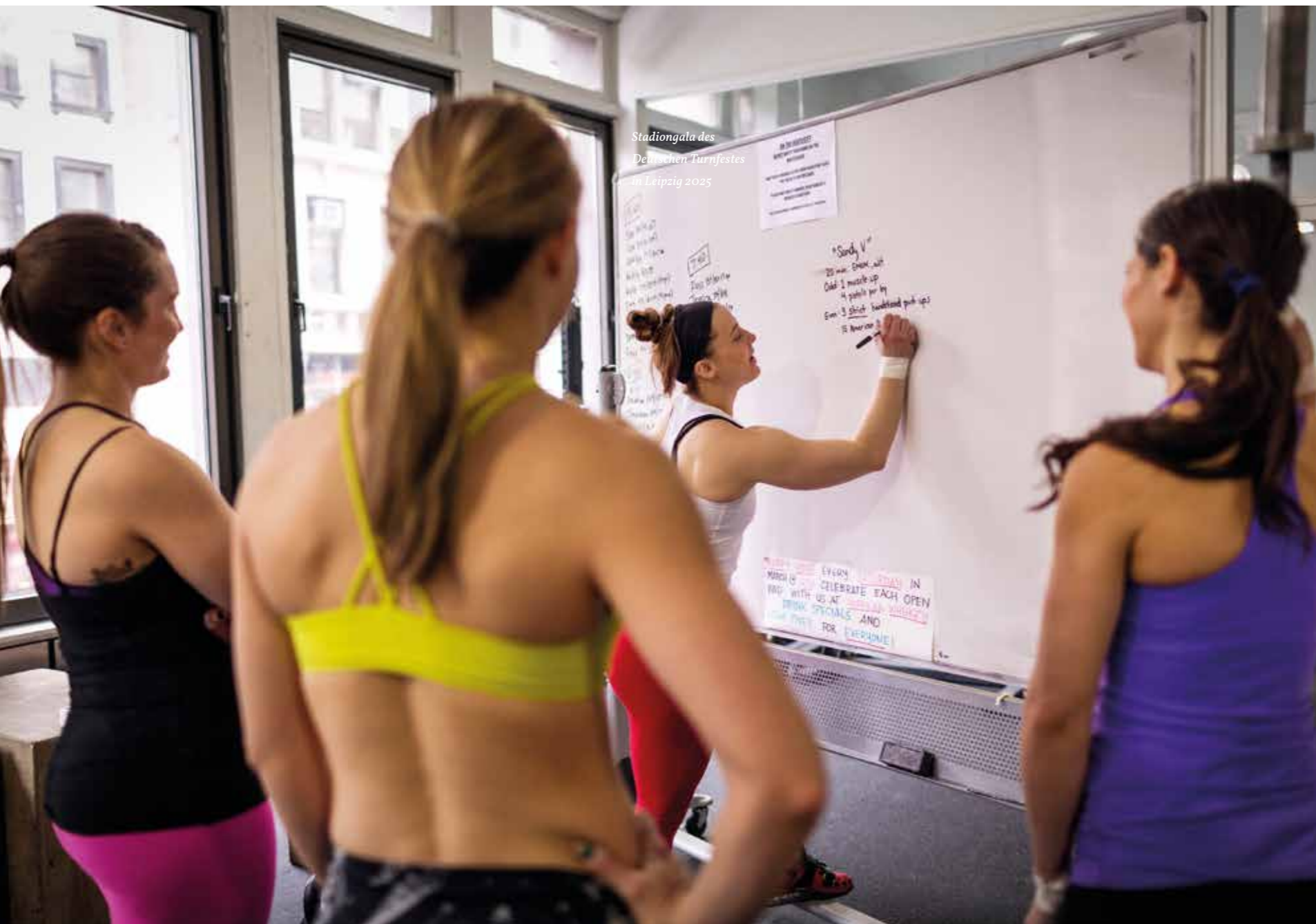
Stadiongala des Deutschen Turnfestes in Leipzig 2025