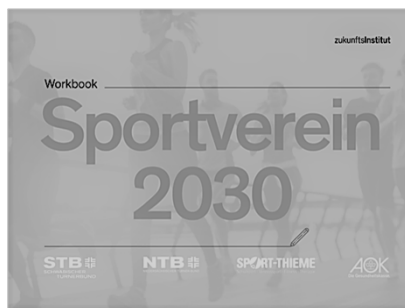
Workbook Sportverein 2030